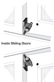
Inside Sliding Doors